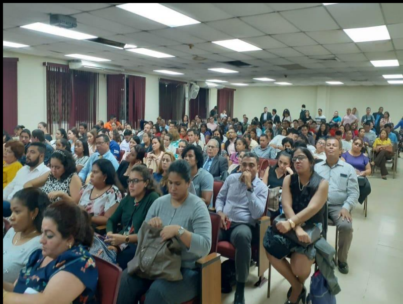
Culminó con un rotundo éxito el Primer Seminario de Derecho Registral. El seminario, que contó con el auspicio y el soporte temático de la Comisión de Derecho Registral del Colegio Nacional de Abogados de Panamá, logró fortalecer los conocimientos en esta materia en beneficio de abogados y estudiantes de la Universidad de Panamá.