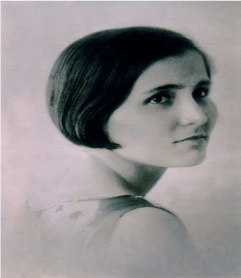
Clara González de Behringuer. Primera Mujer Abogada. Luchó por el Voto a la Mujer. Primera Latinoamericana en obtener el Doctorado en Derecho.

Marco de la conmemoración del Día internacional de la Mujer 8 de marzo